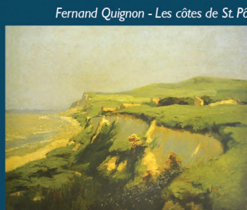
Fernand Quignon - Les côtes de St. Pô